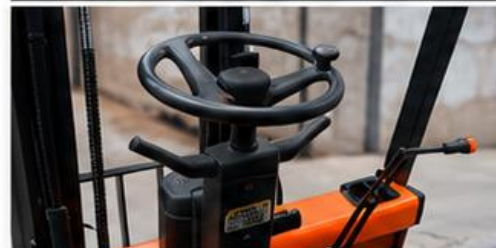
Sistema de control ergonómico