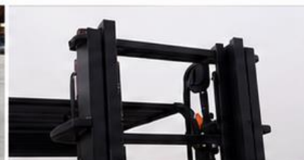
Marco de protección reforzado