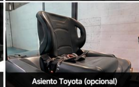
Asiento Toyota (opcional)