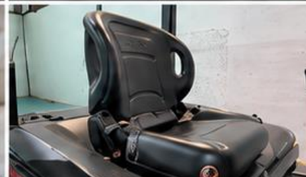
Asiento Toyota (opcional)