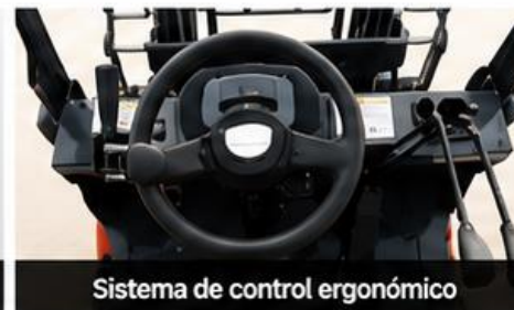
Sistema de control ergonómico