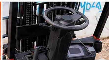
Sistema de control ergonómico