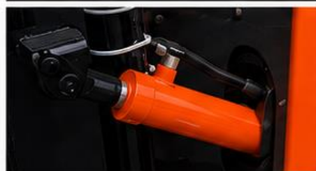
Cilindro hidráulico de alta calidad