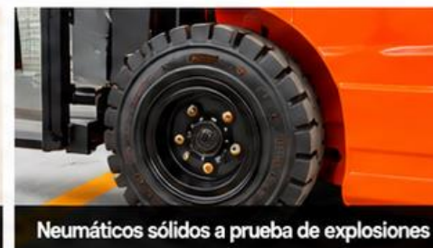
Neumáticos sólidos a prueba de explosiones