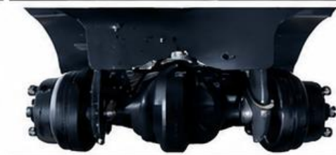
Eje de servicio pesado