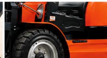
Neumáticos sólidos a prueba de explosiones