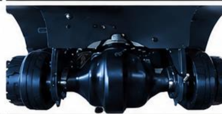
Eje de servicio pesado