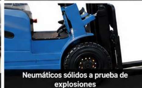
Neumáticos sólidos a prueba de explosiones