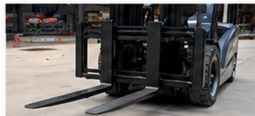
Uñas de horquilla forjadas y reforzadas