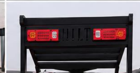
Luz trasera de seguridad LED