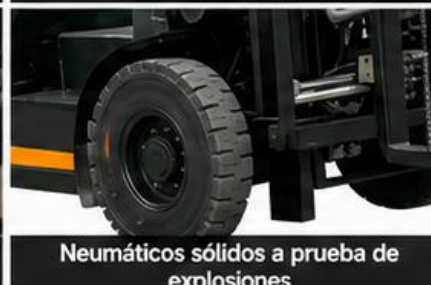
Neumáticos sólidos a prueba de explosiones