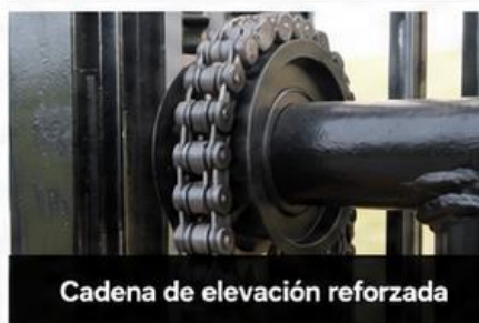
Cadena de elevación reforzada