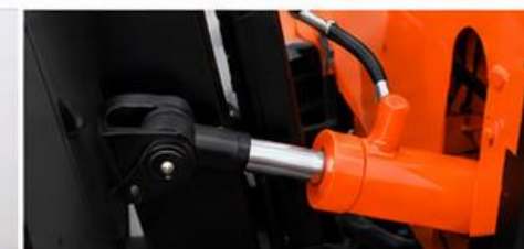
Cilindro hidráulico de alta calidad