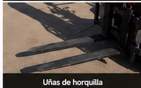
Uñas de horquilla