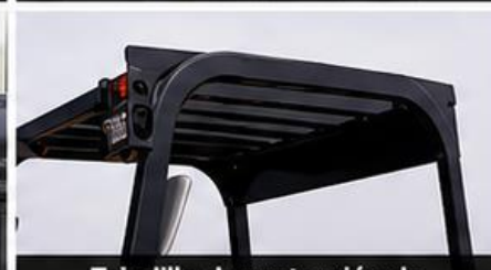
Tejadillo de protección de alta resistencia