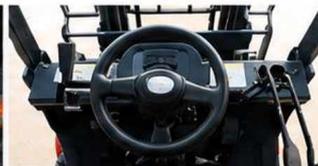
Sistema de control