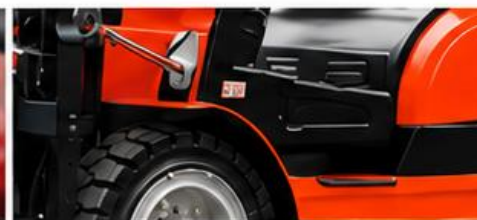
Neumáticos sólidos a prueba de explosiones