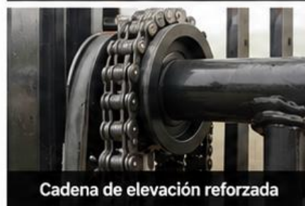
Cadena de elevación reforzada