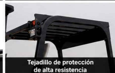
Tejadillo de protección de alta resistencia