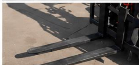
Uñas de horquilla