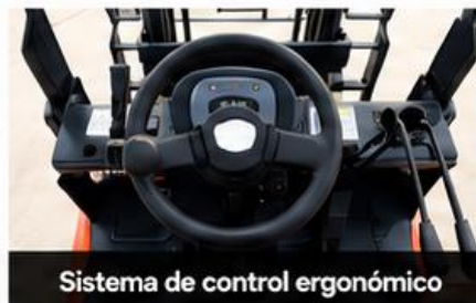
Sistema de control ergonómico