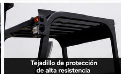
Tejadillo de protección de alta resistencia