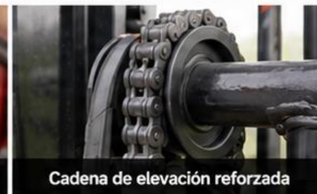
Cadena de elevación reforzada